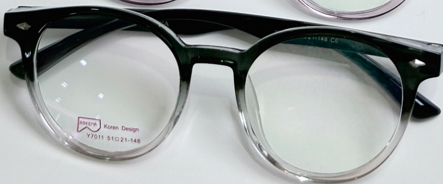
C6亮透墨绿渐果冻茶