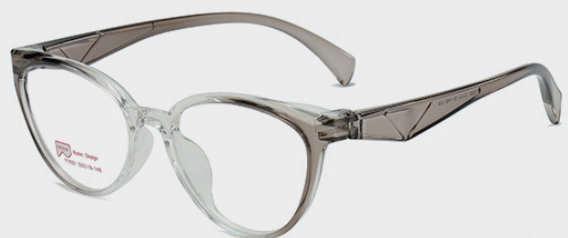
桩头冷茶渐进透明/C5