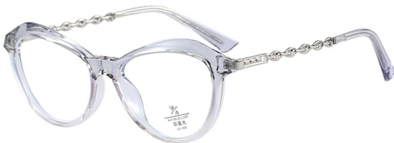
C14 Gradually Blue 渐进蓝