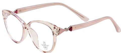
C15 Coffee 咖啡