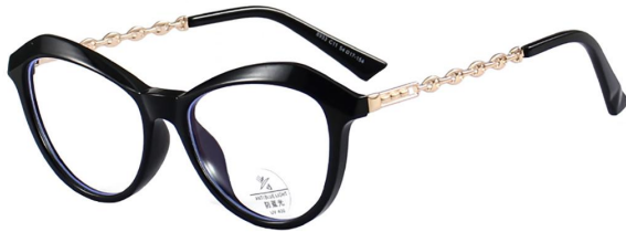
C11 Black/Gold 黑金