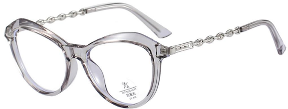
C6 Grey 灰