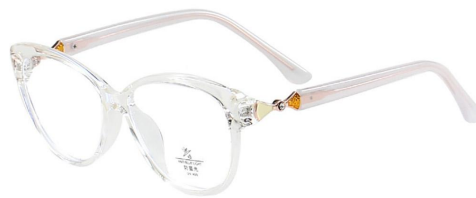
C22 Transparent 透明白