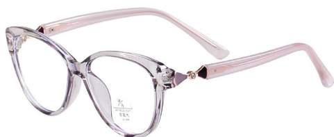
C13 Purple 透紫