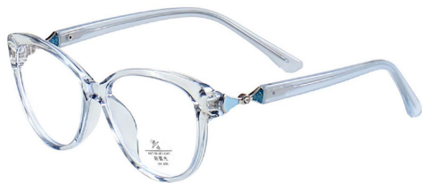
C14 Blue 透蓝