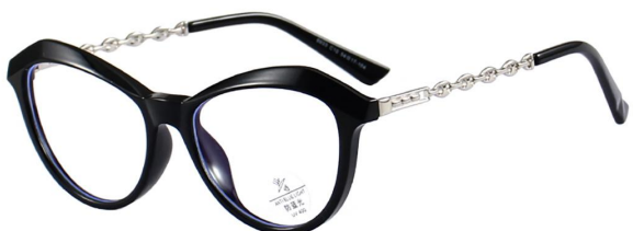
C10 Black/Silvery 黑银