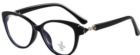
C11 Black/Gold 黑金