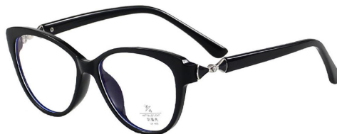
C10 Black/Silvery 黑银