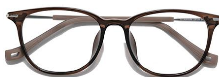
灰绿茶 C69 Green tea