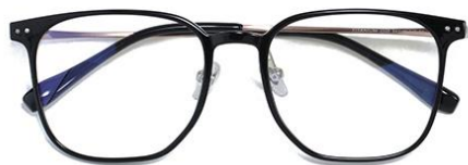
黑玫瑰金C1 Black rose gold