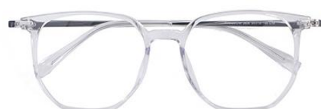
透明白金 C19 Transparent silver