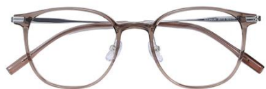
透深茶 C39 Tea