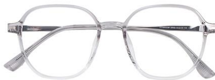
渐变灰 C62 Grey