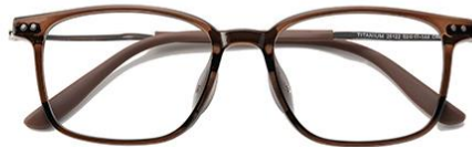
灰绿茶C69 Green tea