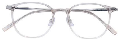
冷茶 C42 Tea