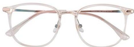
透粉 C16 Pink