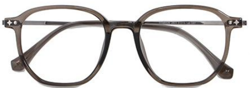
透灰绿 C67 Green