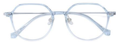
渐变蓝 C49 Blue