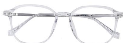
透明白金C19 Transparent silver