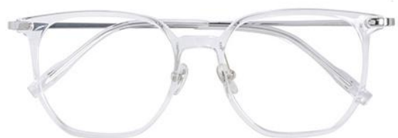
透明白金C19 Transparent silver