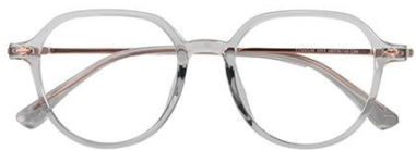
透浅绿 C66 Green