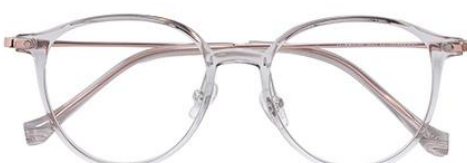
冷茶 C42 Tea