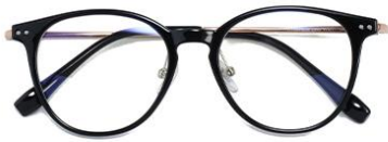
黑玫瑰金C1 Black rose gold