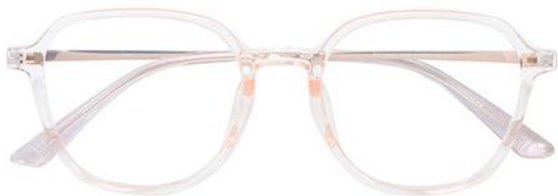
透粉 C16 Pink