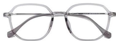
透灰 C62 Grey