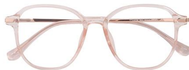
透粉 C16 Pink