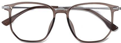
透深茶 C39 Tea