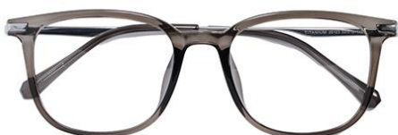
透灰绿 C67 Green