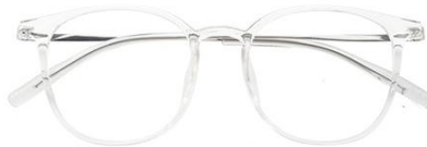
透明/白金C19 Transparent silver