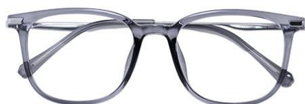
透深灰 C63 Grey