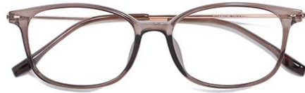
透深茶 C39 Tea