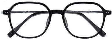
黑白金 C2 Black silver