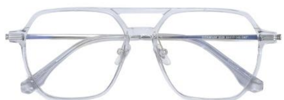
透灰 C62 Grey