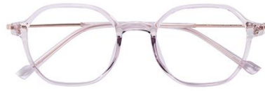
透紫 C20 Purple