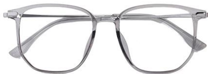
透灰 C62 Grey