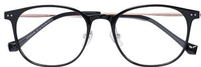
黑玫瑰金 C1 Black rose gold