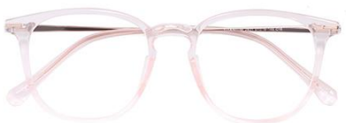
透粉 C16 Pink