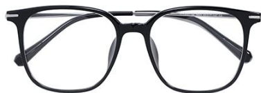
黑白金 C2 Black silver