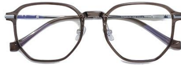
透灰绿C67 Grey green