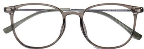
透灰绿 C67 Green