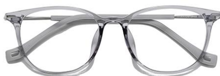
透浅灰 C62 Grey