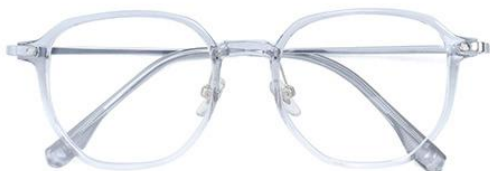
渐变灰 C62 Grey