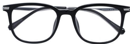
黑白金 C2 Black silver