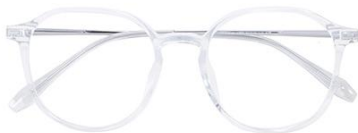
透明白金 C19 Transparent silver