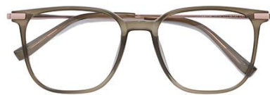
茶绿 C43 Tea