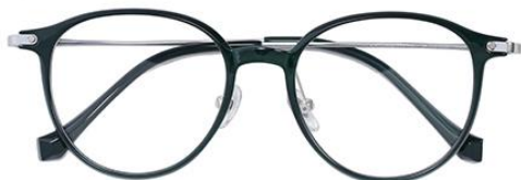
妖绿 C66 Green