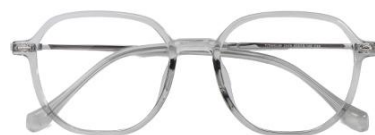
透浅绿 C66 Green