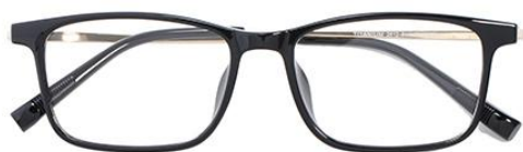
黑金C1 Black gold