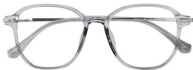
透灰 C62 Grey