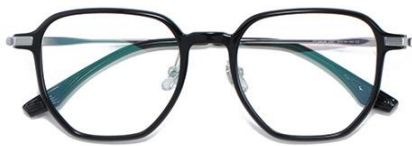
黑白金C2 Black silver