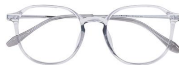
透灰 C62 Grey