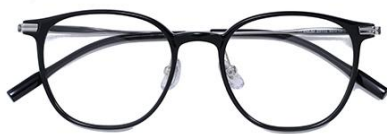
黑白金 C2 Black silver