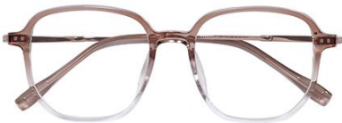
渐茶 C42 Tea