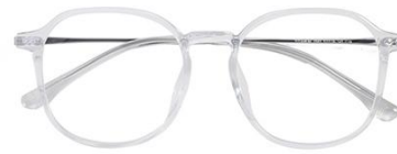
透明白金C19 Transparent silver