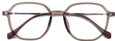
透深茶 C39 Tea