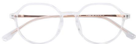
透明玫瑰金C18 Transparent rose gold