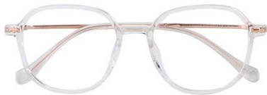
透明玫瑰金 C18 Transparent rose gold