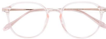
透粉 C16 Pink