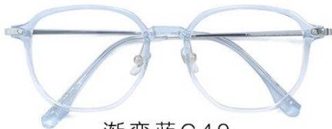
渐变蓝 C49 Blue