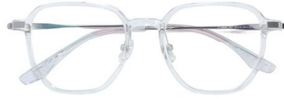
透明白金C19 Transparent silver