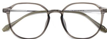
透灰绿 C67 Green