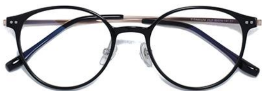
黑玫瑰金C1 Black rose gold