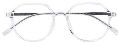
透明黑C33 Transparent black