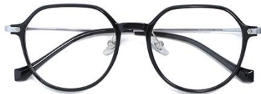
黑银 C2 Black silver