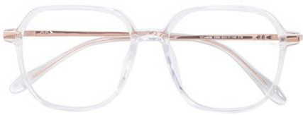
透明玫瑰金C18 Transparent rose gold