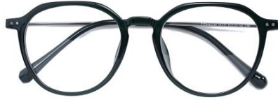
妖绿 C66 Green