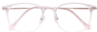
透粉 C16 Pink