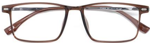
透深茶 C39 Tea