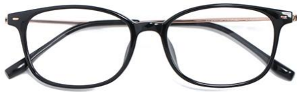
黑玫瑰金 C1 Black rose gold