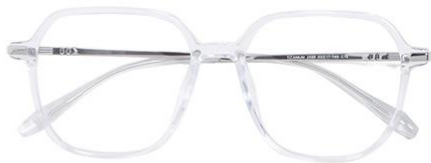
透明白金C19 Transparent silver