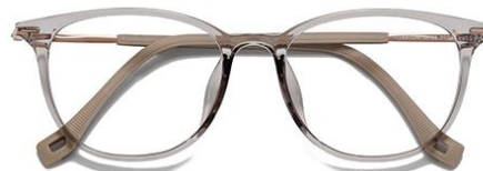
透冷茶 C42 Tea