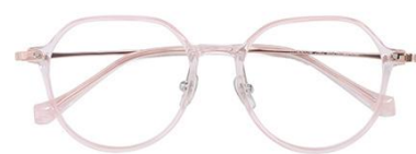
透粉 C16 Pink