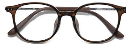
灰绿茶 C69 Green tea