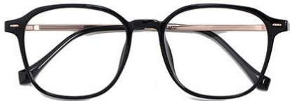
黑玫瑰金C1 Black rose gold