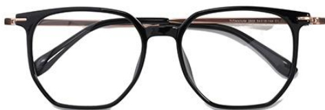
黑玫瑰金 C1 Black rose gold