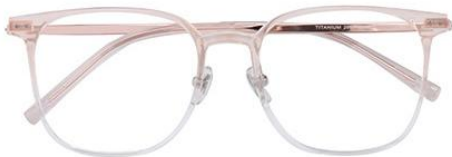
渐变粉 C16 Pink