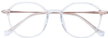
透明玫瑰金C18 Transparent rose gold