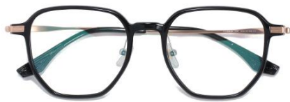
黑玫瑰金C1 Black rose gold