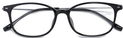
黑白金 C2 Black silver