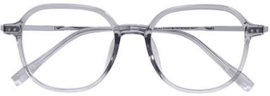
透浅灰 C62 Grey