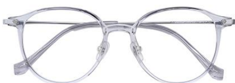
透灰 C62 Grey