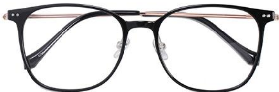
黑玫瑰金 C1 Black rose gold