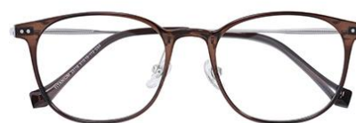
透灰绿茶 C69 Green