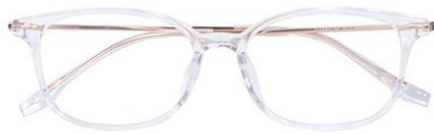
透明玫瑰金 C18 Transparent rose gold