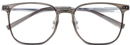
透灰绿 C67-1 Green