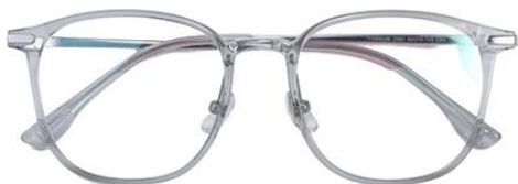
透明灰 C62 Grey