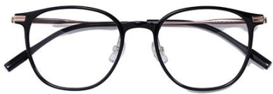
黑玫瑰金 C1 Black rose gold