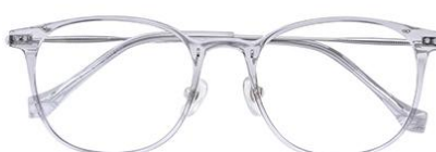
透灰 C62 Grey