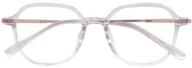
透明玫瑰金 C18 Transparent