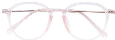
透粉 C16 Pink