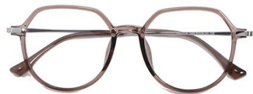
透深茶 C39 Tea