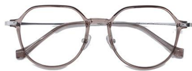
透茶 C39 Tea