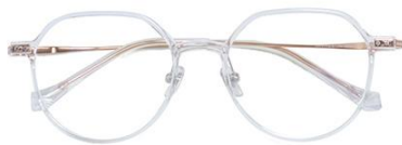
透明玫瑰金C18 Transparent rose gold