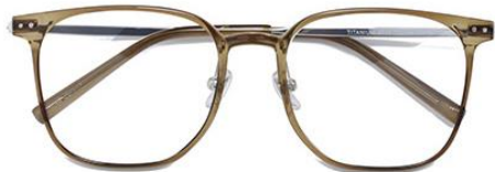
绿 C68 Green