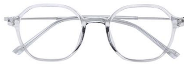
透灰 C62 Grey