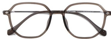
透灰绿 C67 Green