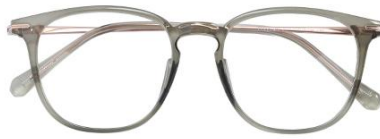
样品绿 C65 Green