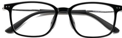
黑白金C2 Black silver