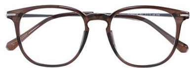
透灰绿茶 C69 Green