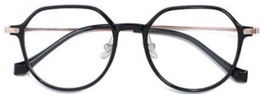
黑玫瑰金 C1 Black rose gold