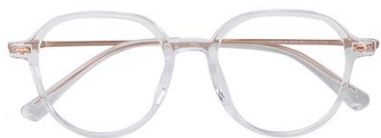
透明玫瑰金 C18 Transparent rose gold