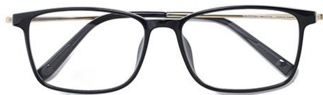
黑金 C1 Black gold