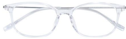
透明白金 C19 Transparent silver