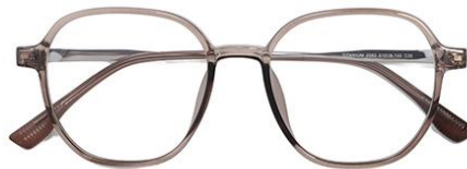
透深茶 C39 Tea