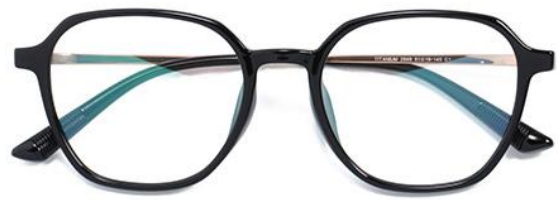
黑玫瑰金 C1 Black rose gold