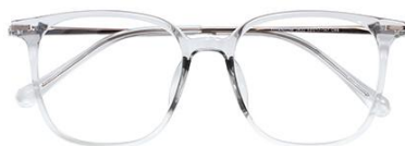
透浅绿 C66 Green