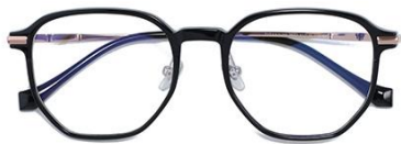
黑玫瑰金C1 Black rose gold