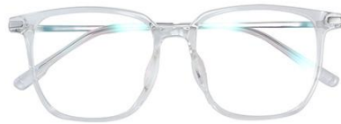
透明白金C19 Transparent silver