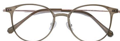
茶绿C43 Tea green