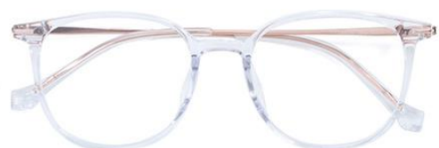
透明玫瑰金C18 Transparent rose gold