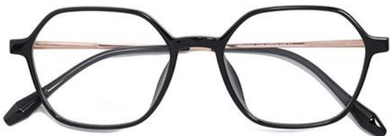
黑玫瑰金 C1 Black rose gold