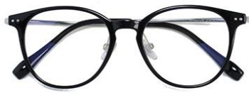
黑白金C2 Black silver