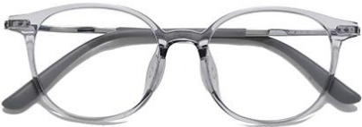
透浅灰 C62 Grey