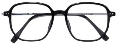
黑白金 C2 Black silver