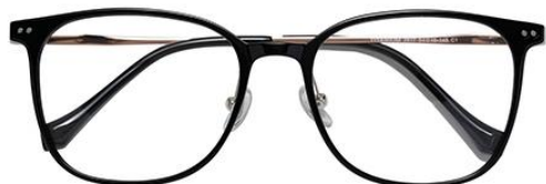
黑玫瑰金 C1 Black rose gold