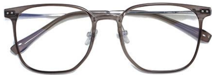
透灰绿C67 Grey green