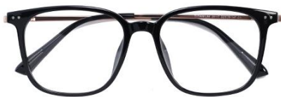
黑玫瑰金C1 Black rose gold