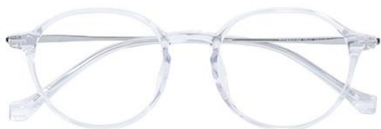
透明白金C19 Transparent silver