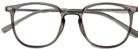
透灰绿 C67 Green