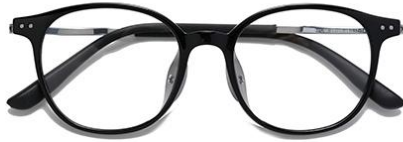
黑白金 C2 Black silver