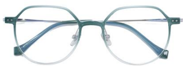
渐蓝绿C51 Blue green