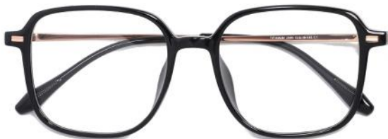
黑玫瑰金C1 Black rose gold