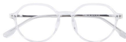
透明白金C19 Transparent silver