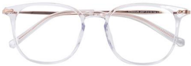
透明玫瑰金C18 Transparent rose gold