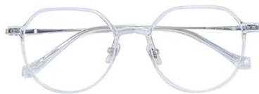
透明白金C19 Transparent silver