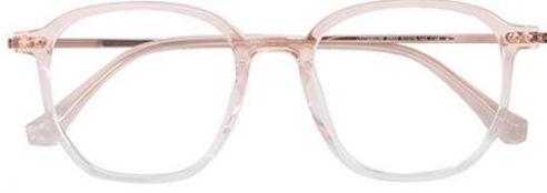
渐变粉 C16 Pink