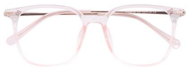
透粉 C16 Pink