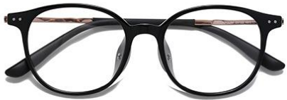
黑玫瑰金 C1 Black rose gold