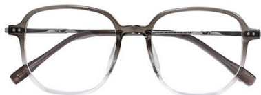
渐变绿 C66 Green