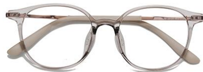
透冷茶 C42 Tea