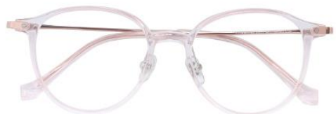
透粉 C16 Pink