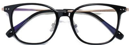
黑玫瑰金 C1 Black rose gold