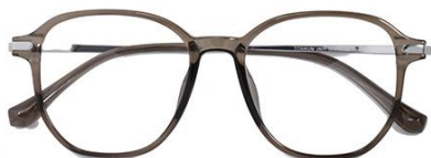
透灰绿 C67 Green