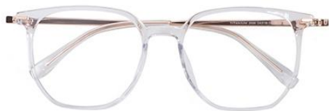
透明玫瑰金 C18 Transparent rose gold