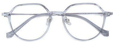
透灰银 C62 Grey