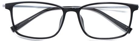
黑白金 C2 Black silver