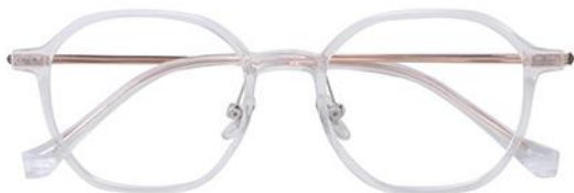
珠光白 C11 White