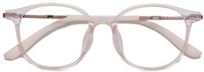
透粉 C16 Pink