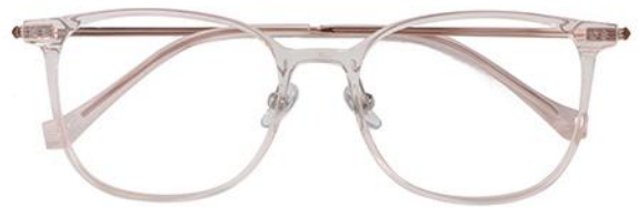
透粉 C16 Pink