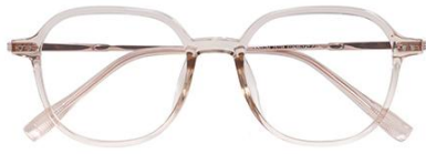
透浅茶 C42 Tea