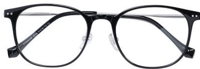
黑白金 C2 Black silver