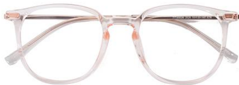
透粉 C16 Pink