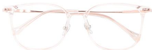
透粉 C16 Pink