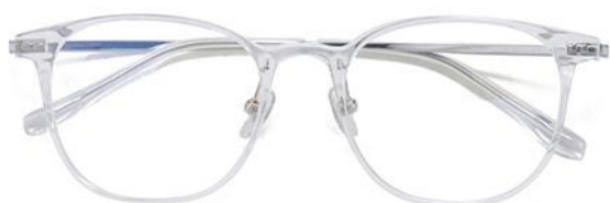
透明白金C19 Transparent silver