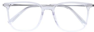
透明白金 C19 Transparent silver