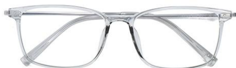
透浅绿 C66 Green