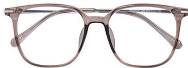
透深茶 C39 Tea