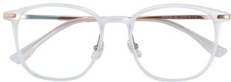
珍珠白 C10 White