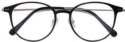
黑玫瑰金C1 Black rose gold