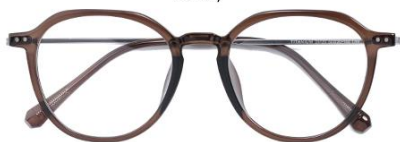
透灰绿茶 C69 Green