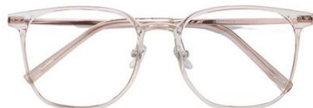
透茶 C40 Tea