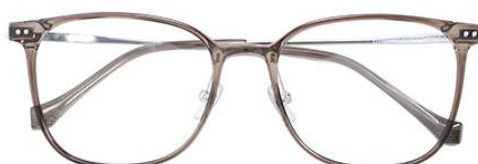
透灰绿 C67 Green