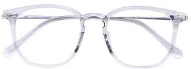
透灰 C62 Grey