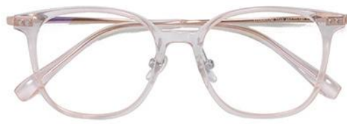
透粉玫瑰金 C16 Pink