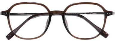
透深茶 C39 Tea