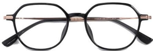
黑玫瑰金C1 Black rose gold