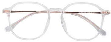
透明玫瑰金C18 Transparent rose gold