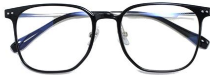
黑白金C2 Black silver