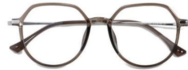
透灰绿 C67 Green