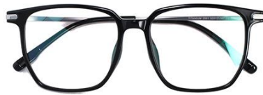
黑白金C2 Black silver