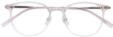
透粉 C16 Pink