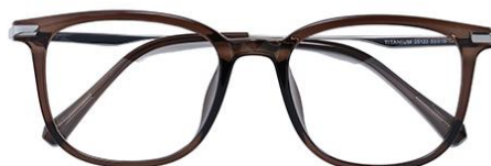
灰绿茶 C69 Green