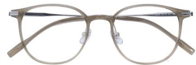
茶绿 C43 Tea green