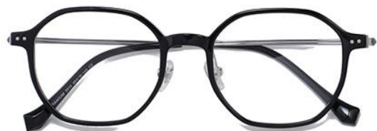
黑白金 C2 Black silver