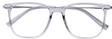
透浅灰 C62 Grey