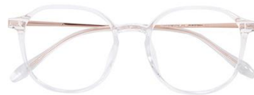
透明玫瑰金 C18 Transparent rose gold