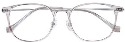
透浅茶 C42 Tea