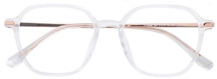
透明玫瑰金C18 Transparent rose gold