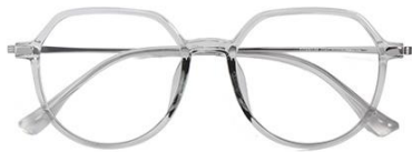
透浅绿 C66 Green