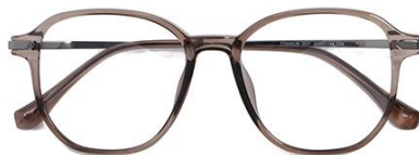
透深茶 C39 Tea