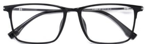
白金C2 Black silver