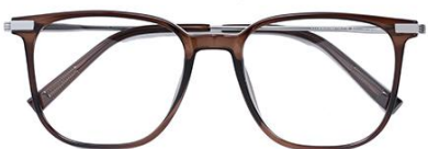
透灰绿茶 C69 Green