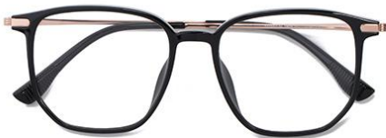
黑玫瑰金 C1 Black rose gold