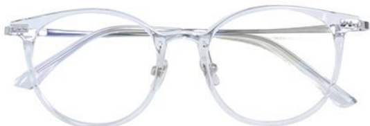
透明白金C19 Transparent silver