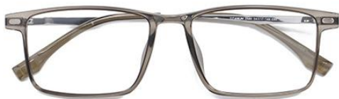
透灰绿 C67 Green