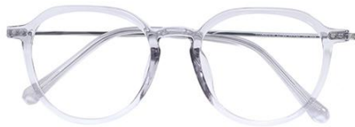
透浅灰 C62 Grey