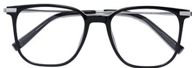
黑白金 C2 Black silver