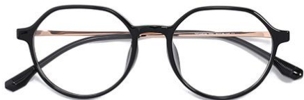
黑玫瑰金C1 Black rose gold