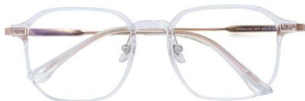
透明玫瑰金C18 Transparent rose gold