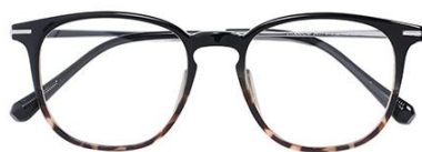
黑玳瑁 C29 Turtle