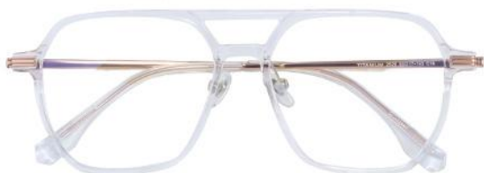
透明玫瑰金 C18 Transparent rose gold