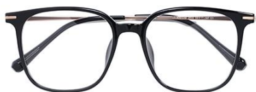
黑玫瑰金 C1 Black rose gold