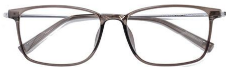
透明灰绿 C67 Green