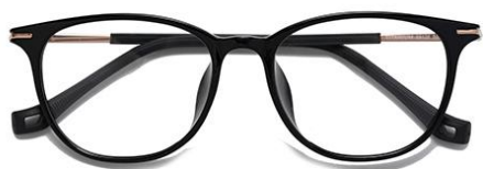
黑玫瑰金 C1 Black rose gold