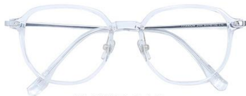
透明银 C19 Transparent silver