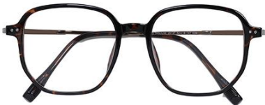
玳瑁 C29 Turtle