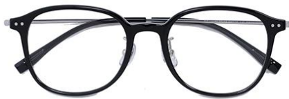
黑白金C2 Black silver