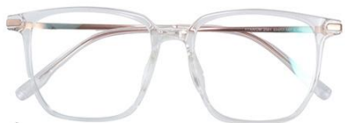
透明玫瑰金C18 Transparent rose gold