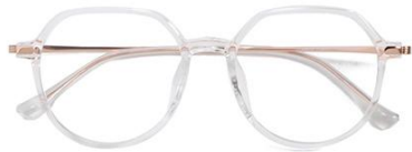
透明玫瑰金 C18 Transparent rose gold