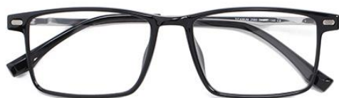
黑白金 C2 Black silver