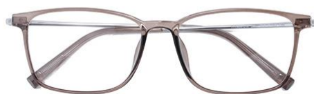
透深茶 C39 Tea