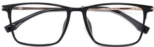
黑金C1 Black gold