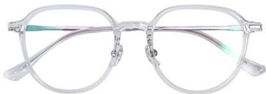
透明白金C19 Transparent silver