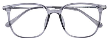
透深灰 C63 Grey