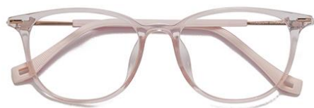
透粉 C16 Pink