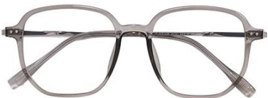
浅灰绿 C65 Green