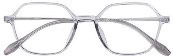
透灰 C62 Grey