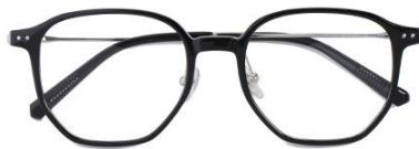
黑白金C2 Black silver