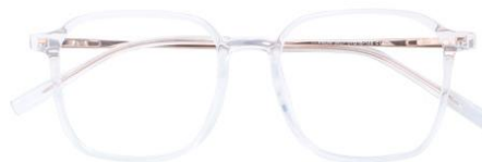
透明玫瑰金C18 Transparent rose gold