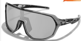
C1 镜框: 透灰框 镜片: 水银片