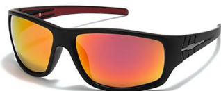
C7 镜框: 黑框 镜片: 落日片