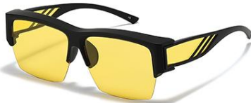
C1 镜框:黑框 镜片:夜视黄片