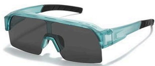
C5 镜框:蓝绿框 镜片:黑灰片