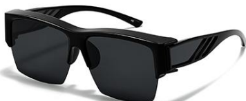
C5 镜框:亮黑框 镜片:黑灰片