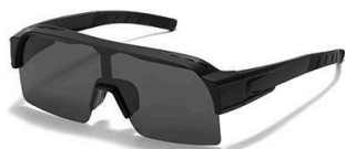
C1 镜框:黑框 镜片:黑灰片