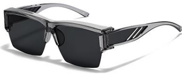
C3 镜框:透灰框 镜片:黑灰片