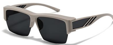
C2 镜框:奶茶框 镜片:黑灰片