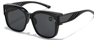
C2 镜框:亮黑框 镜片:黑灰片