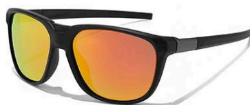
C7 镜框: 砂黑框 | 镜片: 橘红片