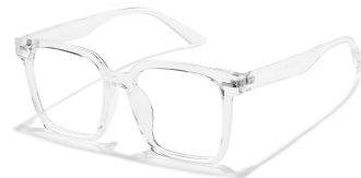
C2 镜框:透明框 镜片:防蓝光/偏光