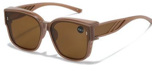
C5 镜框:茶框 镜片:茶片