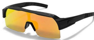
C2 镜框:黑框 镜片:炫彩橘红片