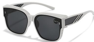
C7 镜框:灰框 镜片:黑灰片