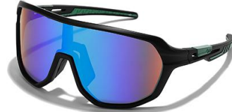
C4 镜框: 黑框 镜片: 炫绿片