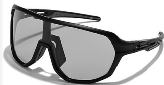
C7 镜框: 黑框 镜片: 灰片