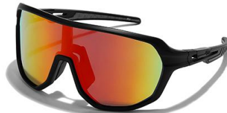
C2 镜框: 黑框 镜片: 炫彩橘红片