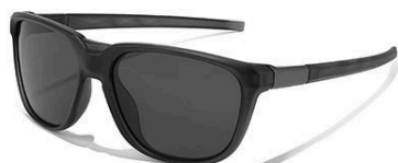
C2 镜框: 砂黑框 | 镜片: 黑灰片