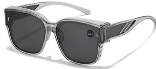
C3 镜框:透灰框 镜片:黑灰片