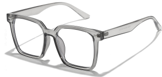
C3 镜框:透灰框 镜片:防蓝光/偏光