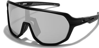
C6 镜框: 黑框 镜片: 水银片