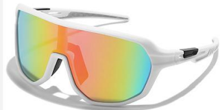
C5 镜框: 白框 镜片: 炫彩片