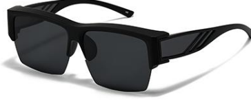
C4 镜框:砂黑框 镜片:黑灰片