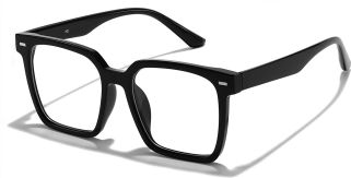
C1 镜框:亮黑框 镜片:防蓝光/偏光