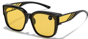
C1 镜框:亮黑框 镜片:夜视黄片