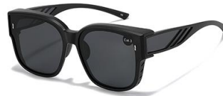
C4 镜框:砂黑框 镜片:黑灰片