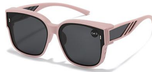
C6 镜框:砂粉框 镜片:黑灰片