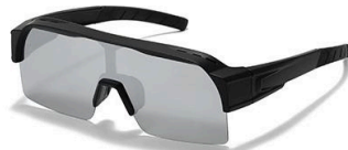
C4 镜框:黑框 镜片:水银片