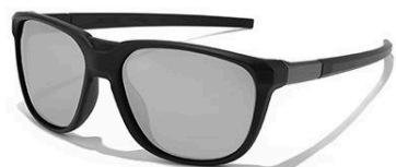
C4 镜框: 砂黑框 | 镜片: 水银片