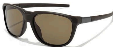
C5 镜框: 砂棕框 | 镜片: 茶片