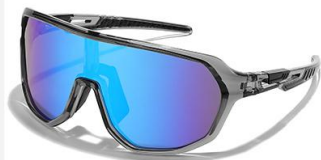
C3 镜框: 透灰框 镜片: 炫蓝片