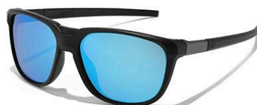
C3 镜框: 砂黑框 | 镜片: 炫蓝片