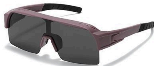
C7 镜框:豆沙框 镜片:黑灰片