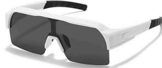
C6 镜框:白框 镜片:黑灰片