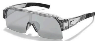
C3 镜框:灰框 镜片:水银片