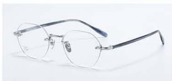
C1 镜框: 素银&条纹透灰兰 材质: 纯钛+板材