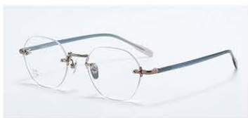
C3 镜框: 香槟&浊兰透灰渐变 材质: 纯钛+板材