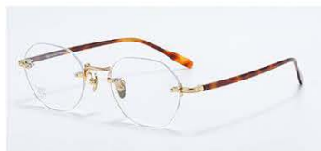
C2 镜框: 浅金&深棕玳瑁 材质: 纯钛+板材