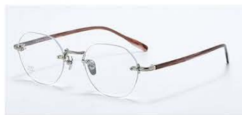
C4 镜框: 古铜&条纹透紫咖 材质: 纯钛+板材