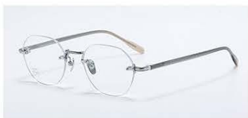
C5 镜框: 素银&条纹浊兰咖 材质: 纯钛+板材