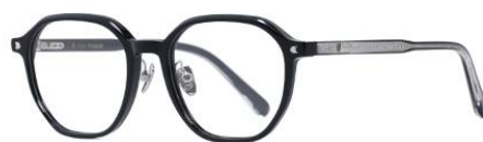
黑银BK102 Black silver