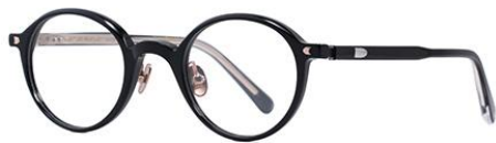
黑玫瑰金BK101 Black rose gold