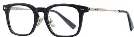
黑浅金BK101 Black gold