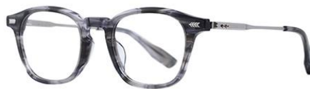
玳瑁灰DM010 Turtle grey