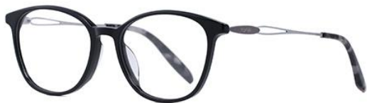
黑白金BK102 Black silver