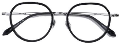
黑白金BK102 Black silver