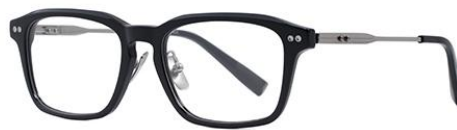
黑枪BK103 Black gun