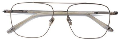
古铜拉丝 C9 Brown