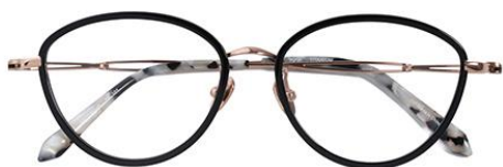
黑玫瑰金BK101 Black rose gold