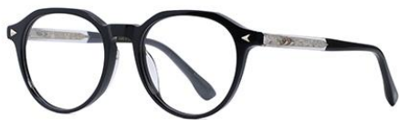
黑金BK101 Black gold