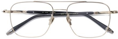
浅金 C6 Gold