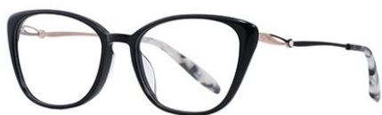
黑玫瑰金BK101 Black rose gold