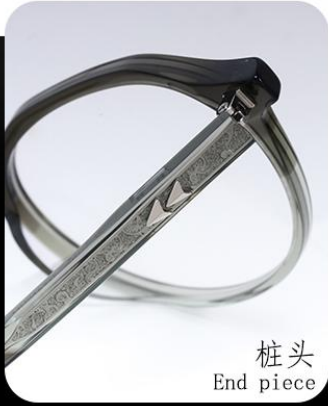
桩头 End piece