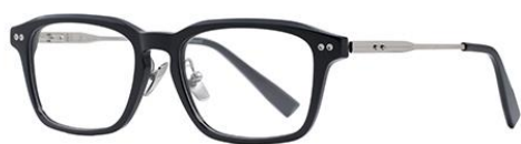
黑白金BK102 Black silver