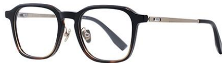
上黑下玳瑁DM901 Black turtle