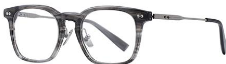
灰条纹DM033 Grey stripe