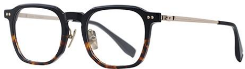
黑玳瑁茶BK907 Blue turtle tea