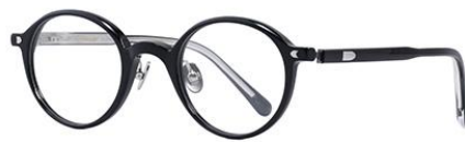
黑白金BK102 Black silver