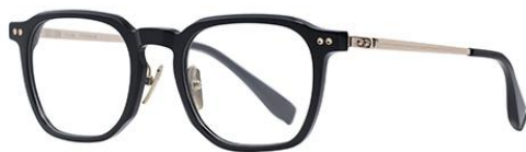
黑浅金BK101 Black gold