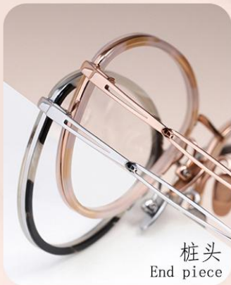
桩头 End piece