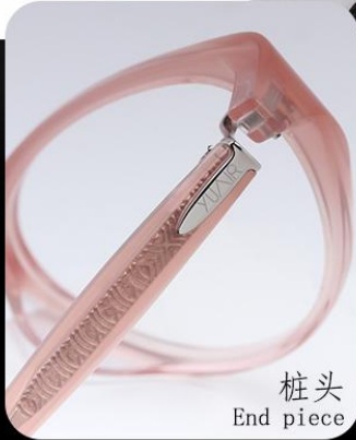
桩头 End piece