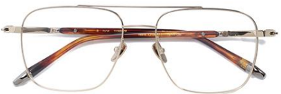
浅金 C84 Gold