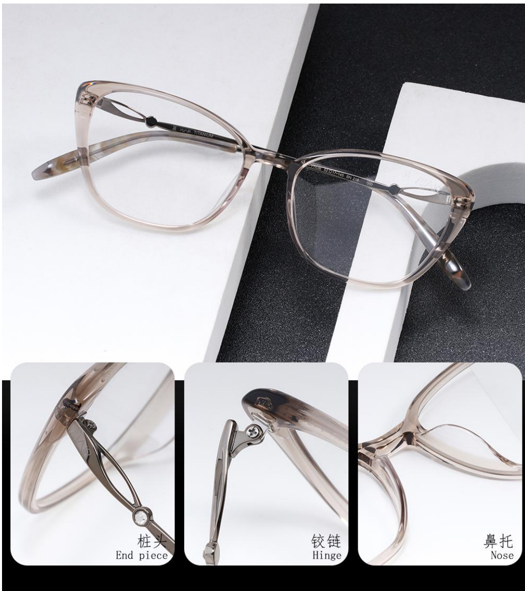
桩头 End piece