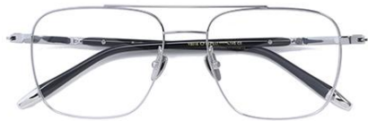
银 C5 Silver