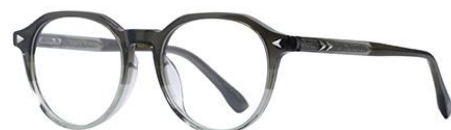
渐变绿GN659 Gradient green