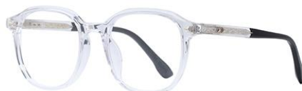
透明金TM018 Transparent gold