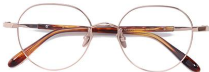
玫瑰金C7 Rose gold