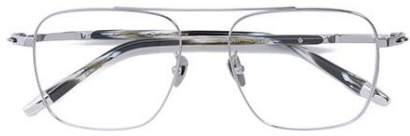
银 C85 Silver