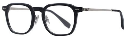
黑白金BK102 Black silver