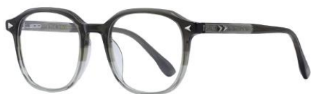
渐变绿GN659 Gradient green