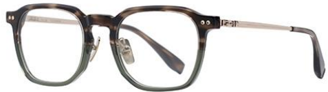
玳瑁绿茶DM205 Turtle green