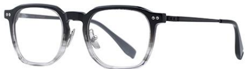
黑玳瑁灰DM319 Black turtle grey