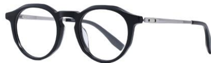
黑白金BK102 Black silver