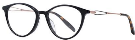
黑玫瑰金BK101 Black rose gold