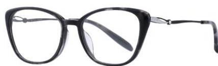
黑花DM338 Black turtle