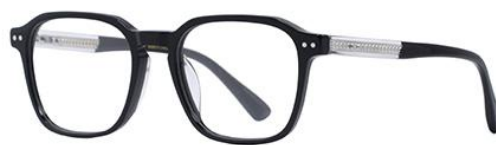
黑白金BK102 Black silver