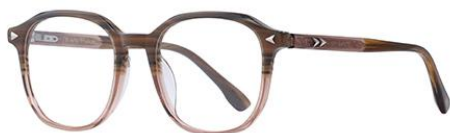
上茶下红棕BN901 Tea brown