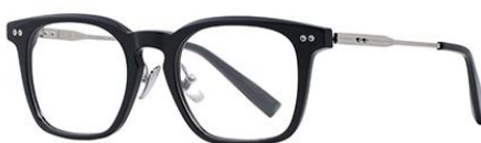
黑白金BK102 Black silver