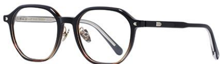
上黑下玳瑁DM901 Black turtle