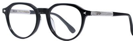
黑白金BK102 Black silver