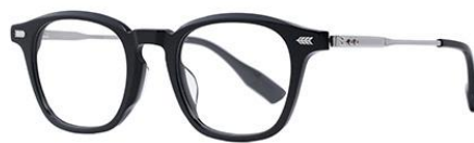
黑白金BK102 Black silver