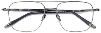
枪拉丝 C8 Gun