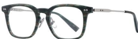
绿玳瑁DM394 Green turtle