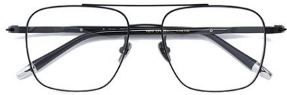
哑黑 C32 Black