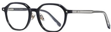
黑浅金BK101 Black gold