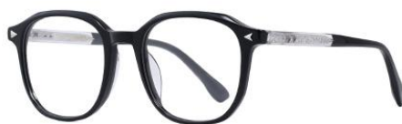
黑白金BK102 Black silver