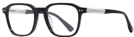
黑金BK101 Black gold