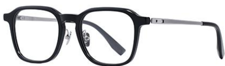
黑/银BK102 Black silver