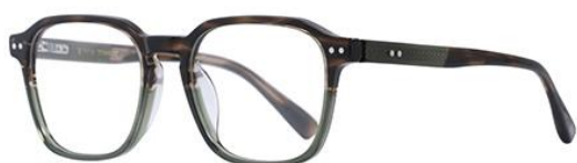
上玳瑁下灰绿DM205 Tuettele green