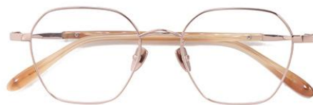
玫瑰金C7 Rose gold