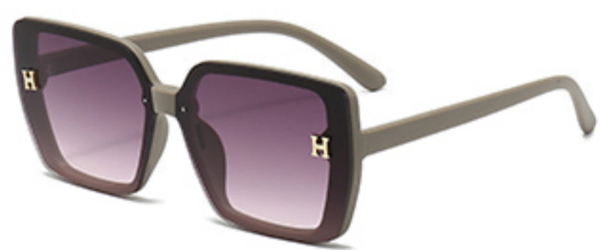
C5/砂奶灰框渐红灰片