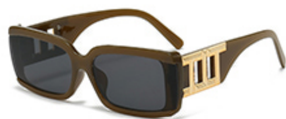
■ C4果冻深绿框黑灰片