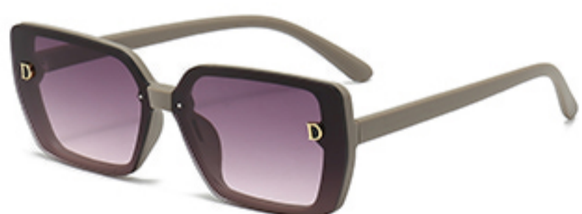
C7/砂奶灰框渐红灰片