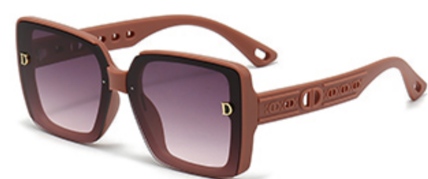
C3/砂实粉框渐红灰片