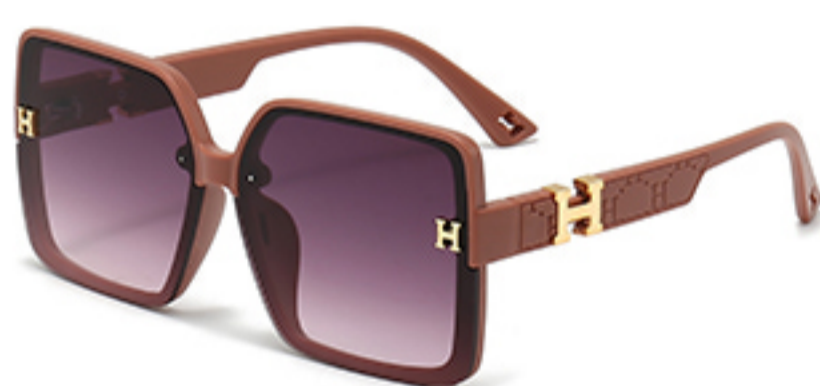
C3/砂实粉框渐红灰片