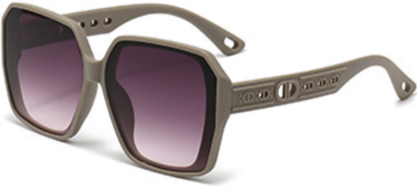
C9/砂奶灰框渐红灰片