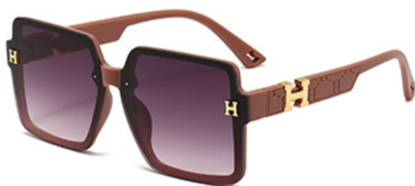
C5/砂实粉框渐红灰片