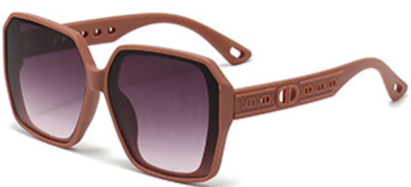
C3/砂实粉框渐红灰片