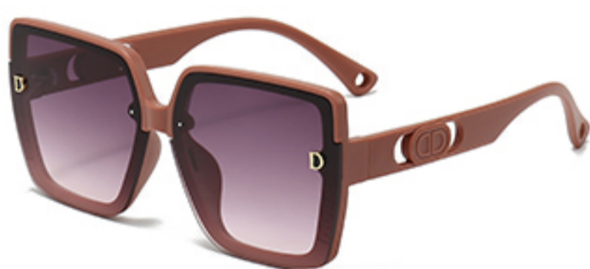
C5/砂实粉框渐红灰片