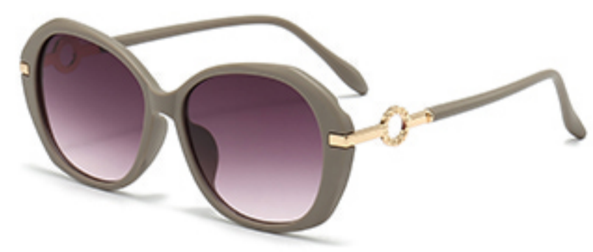
C9/砂奶灰框渐红灰片