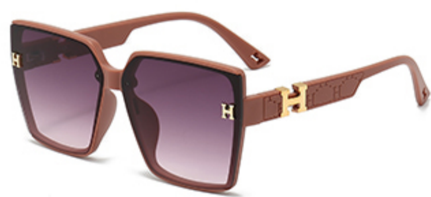
C5/砂实粉框渐红灰片