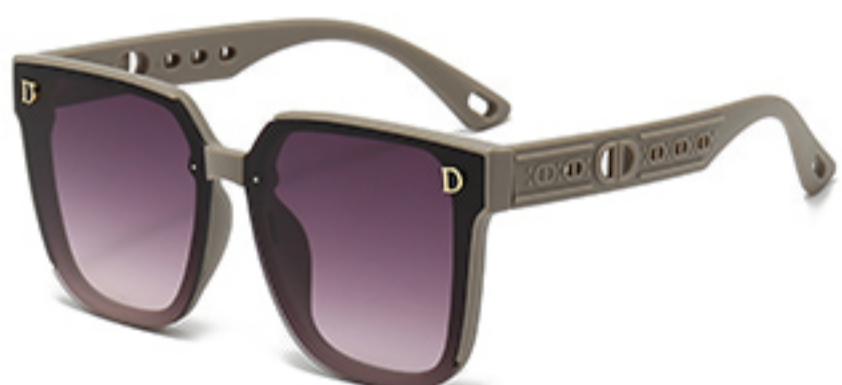
C7/砂奶灰框渐红灰片