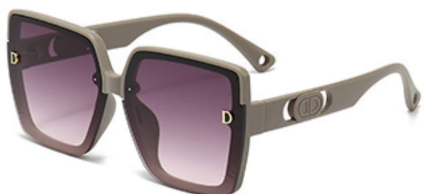
C7/砂奶灰框渐红灰片