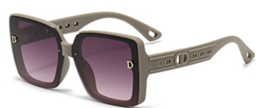
C9/砂奶灰框渐红灰片