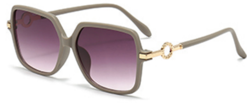
C9/砂奶灰框渐红灰片