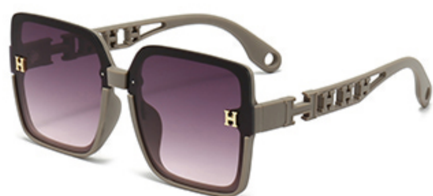
C7/砂奶灰框渐红灰片