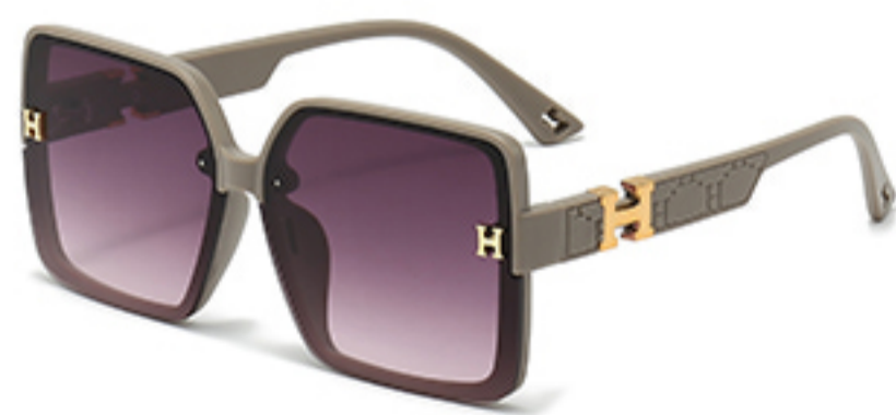
C9/砂奶灰框渐红灰片