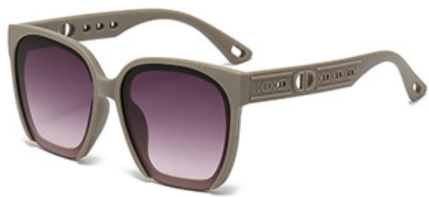
C7/砂奶灰框渐红灰片