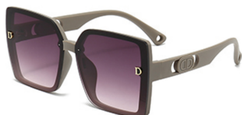
C7/砂奶灰框渐红灰片