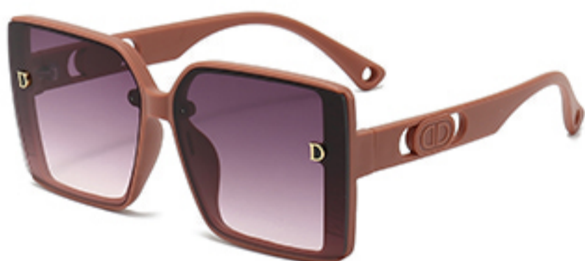
C5/砂实粉框渐红灰片