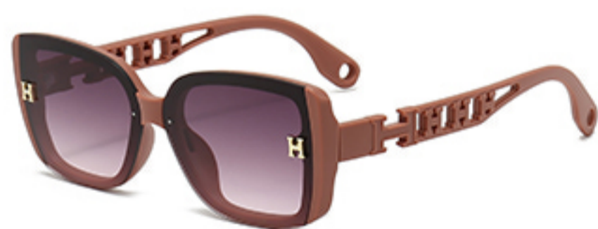
C5/砂实粉框渐红灰片