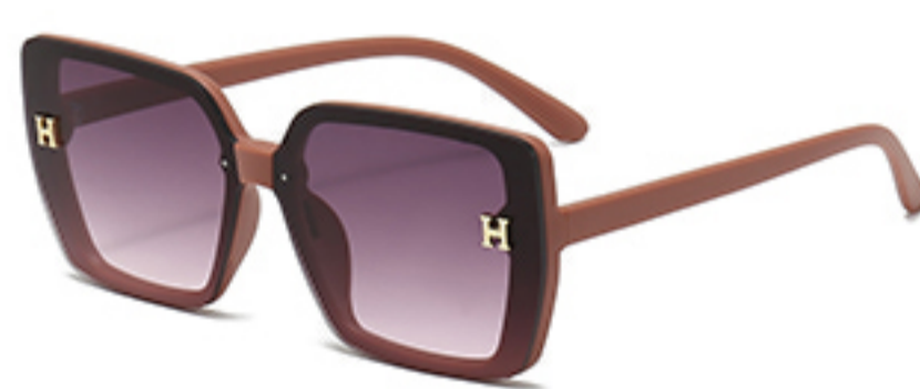
C4/砂实粉框渐红灰片