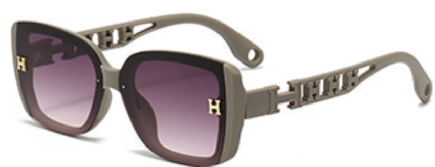
C7/砂奶灰框渐红灰片