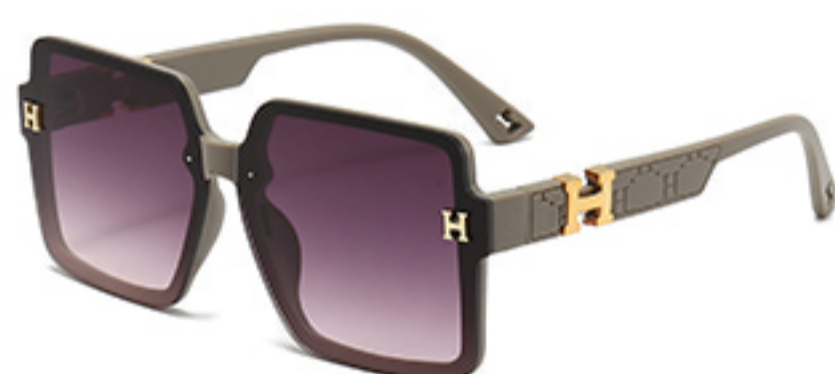
C7/砂奶灰框渐红灰片