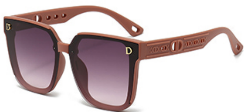
C5/砂实粉框渐红灰片