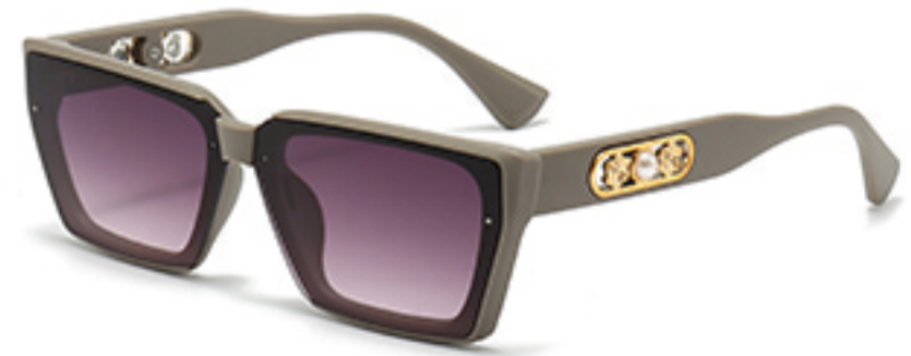
C9/砂奶灰框渐红灰片