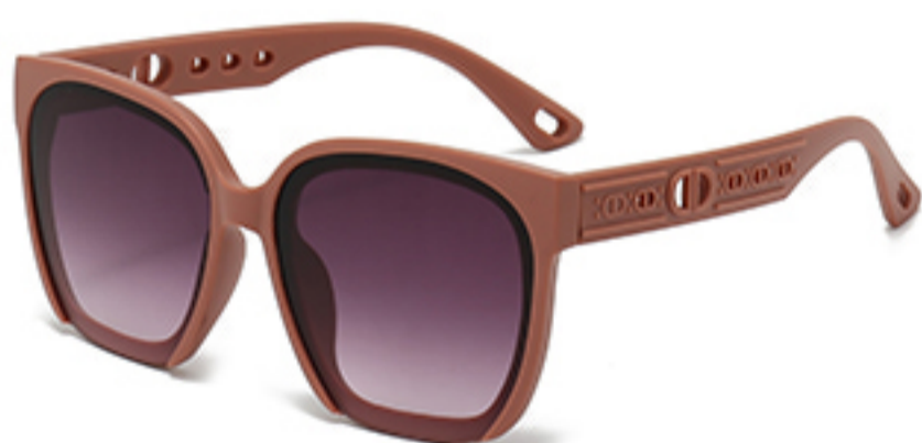
C5/砂实粉框渐红灰片