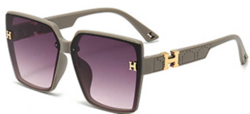
C7/砂奶灰框渐红灰片