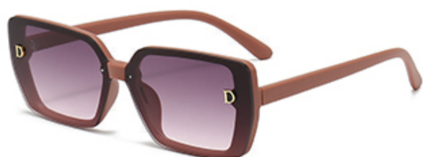
C5/砂实粉框渐红灰片