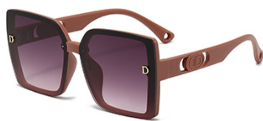
C5/砂实粉框渐红灰片