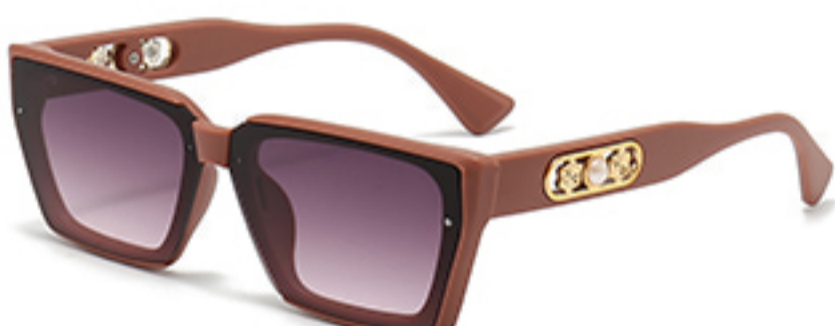
C3/砂实粉框渐红灰片