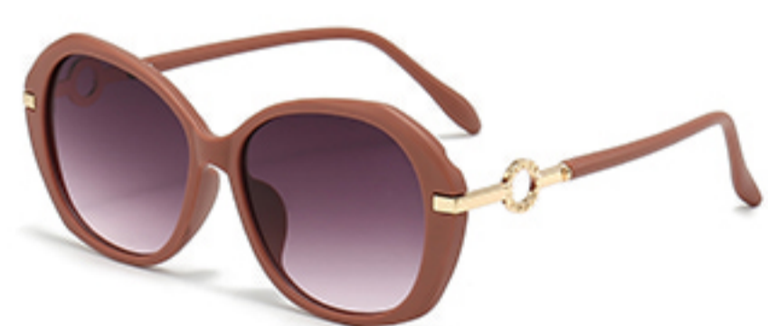
C3/砂实粉框渐红灰片