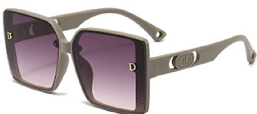
C7/砂奶灰框渐红灰片