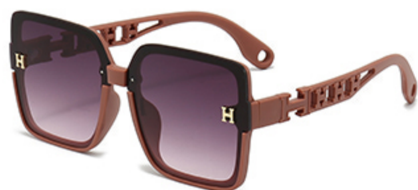
C5/砂实粉框渐红灰片