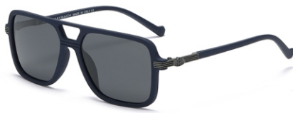
弹蓝框 黑灰片 Bullet blue