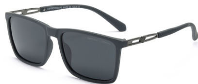
弹灰框 黑灰片 Bullet grey