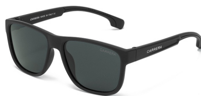
弹黑框 黑灰片 Bullet black