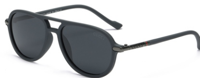
弹灰框 黑灰片 Bullet grey