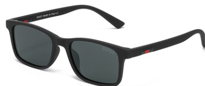
弹黑框 黑灰片 Bullet black