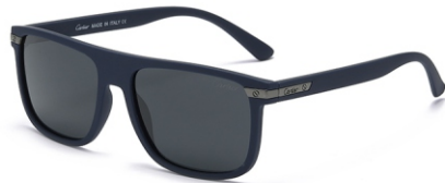
弹蓝框 黑灰片 Bullet blue