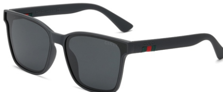
弹灰框 黑灰片 Bullet grey