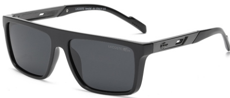
亮黑框 黑灰片 Glossy black