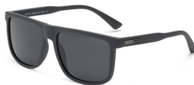
弹灰框 黑灰片 Bullet grey