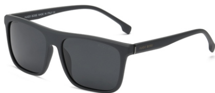
弹灰框 黑灰片 Bullet grey