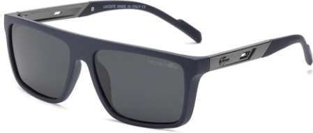
弹蓝框 黑灰片 Bullet blue