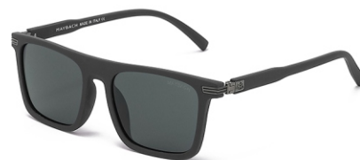
弹灰框 黑灰片 Bullet grey