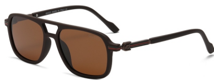
弹棕框 茶片 Bullet brown