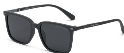
弹灰框 黑灰片 Bullet grey