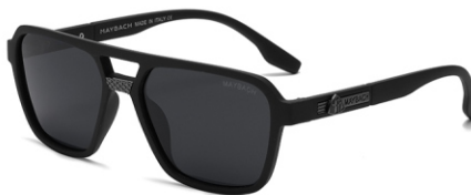
弹黑框 黑灰片 Bullet black