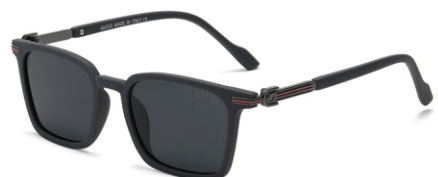
弹灰框 黑灰片 Bullet grey