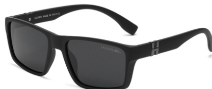
弹黑框 黑灰片 Bullet black