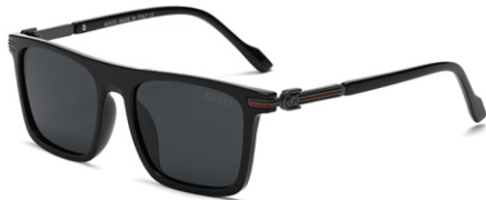
亮黑框 黑灰片 Glossy black