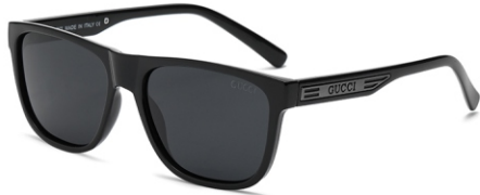
亮黑框 黑灰片 Glossy black