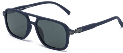
弹蓝框 黑灰片 Bullet blue