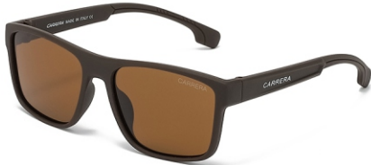
弹棕框 茶片 Bullet brown