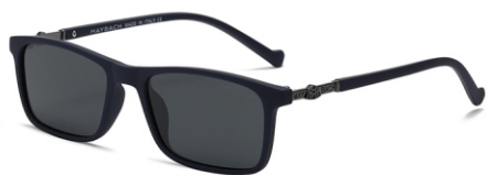
弹蓝框 黑灰片 Bullet blue