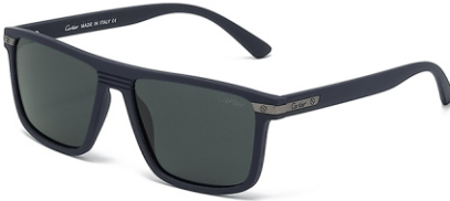
弹蓝框 黑灰片 Bullet blue