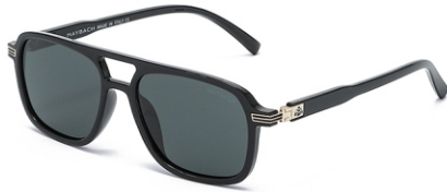
亮黑框 黑灰片 Glossy black