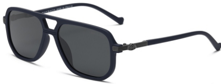
弹蓝框 黑灰片 Bullet blue