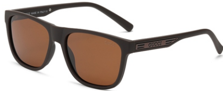
弹棕框 茶片 Bullet brown