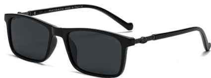
亮黑框 黑灰片 Glossy black