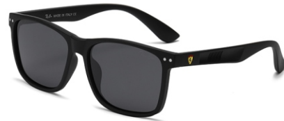
弹黑框 黑灰片 Bullet black