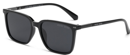
亮黑框 黑灰片 Glossy black