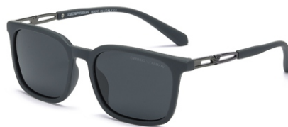
弹灰框 黑灰片 Bullet grey