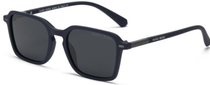
弹蓝框 黑灰片 Bullet blue