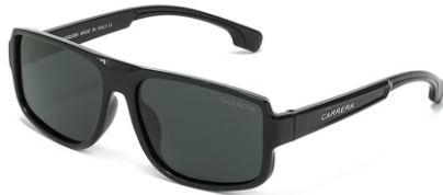
亮黑框 黑灰片 Glossy black