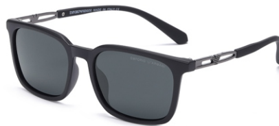
弹黑框 黑灰片 Bullet black