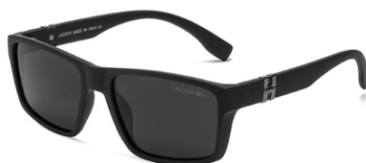
弹黑框 黑灰片 Bullet black