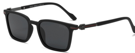
弹黑框 黑灰片 Bullet black