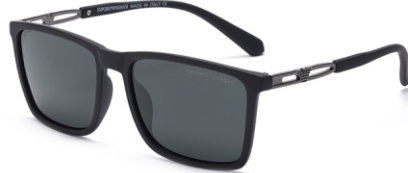
弹黑框 黑灰片 Bullet black