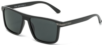
亮黑框 黑灰片 Glossy black