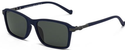
弹蓝框 黑灰片 Bullet blue