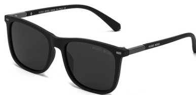
弹黑框 黑灰片 Bullet black