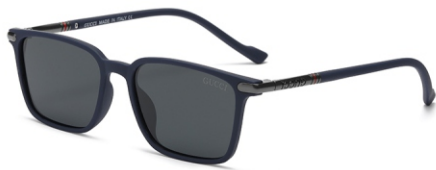
弹蓝框 黑灰片 Bullet blue