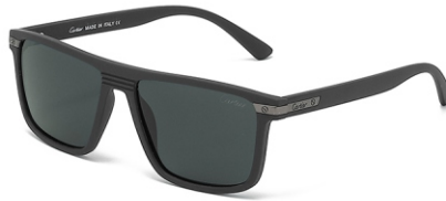
弹灰框 黑灰片 Bullet grey