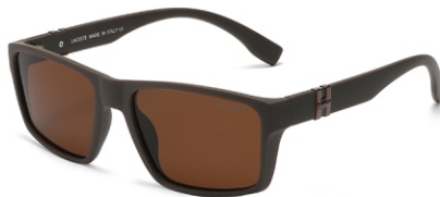
弹棕框 茶片 Bullet brown