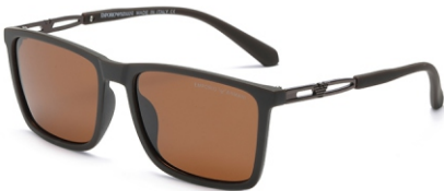
弹棕框 茶片 Bullet brown