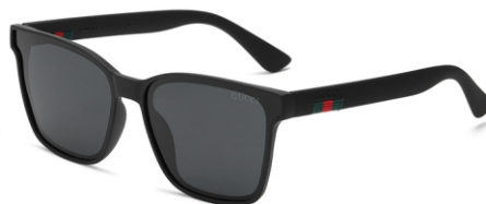
弹黑框 黑灰片 Bullet black