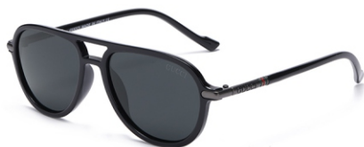
亮黑框 黑灰片 Glossy black