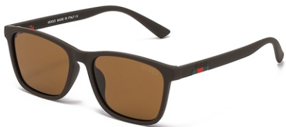
弹棕框 茶片 Bullet brown