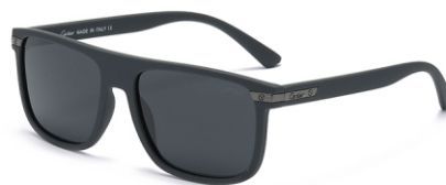
弹灰框 黑灰片 Bullet grey