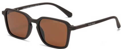
弹棕框 茶片 Bullet brown