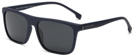
弹蓝框 黑灰片 Bullet blue