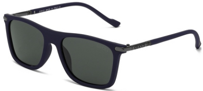
弹蓝框 黑灰片 Bullet blue