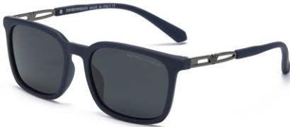
弹蓝框 黑灰片 Bullet blue