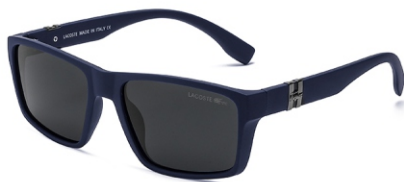
弹蓝框 黑灰片 Bullet blue