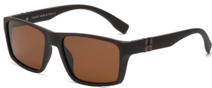
弹棕框 茶片 Bullet brown