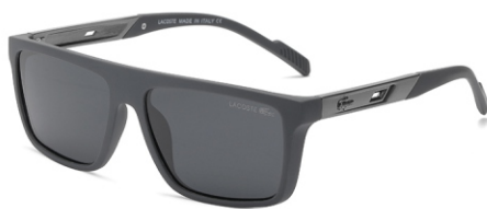
弹灰框 黑灰片 Bullet grey