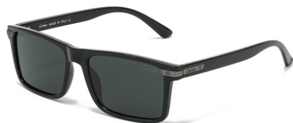
亮黑框 黑灰片 Glossy black