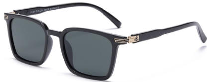
亮黑框 黑灰片 Glossy black