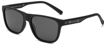
弹黑框 黑灰片 Bullet black