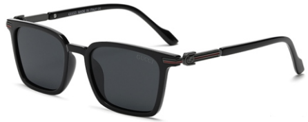
亮黑框 黑灰片 Glossy black