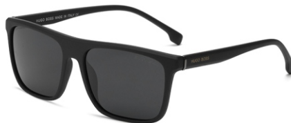
弹黑框 黑灰片 Bullet black