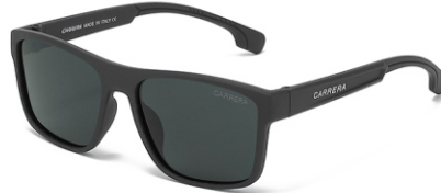
弹灰框 黑灰片 Bullet grey