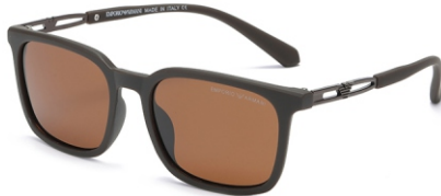
弹棕框 茶片 Bullet brown