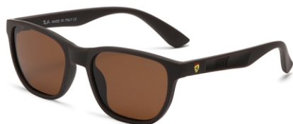
弹棕框 茶片 Bullet brown