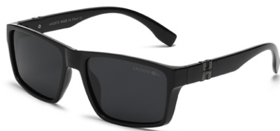
亮黑框 黑灰片 Glossy black