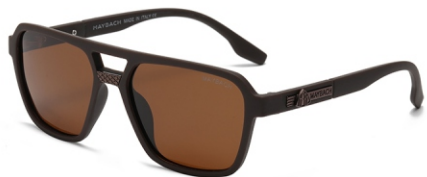
弹棕框 茶片 Bullet brown