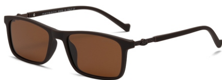
弹棕框 茶片 Bullet brown