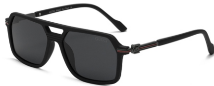
弹黑框 黑灰片 Bullet black