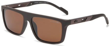
弹棕框 茶片 Bullet brown