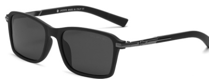
弹黑框 黑灰片 Bullet black