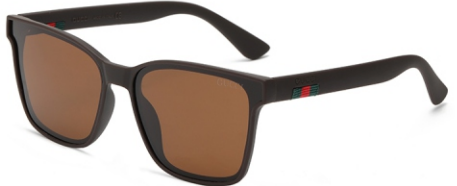
弹棕框 茶片 Bullet brown