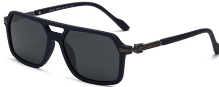
弹蓝框 黑灰片 Bullet blue