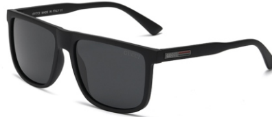
弹黑框 黑灰片 Bullet black