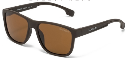
弹棕框 茶片 Bullet brown