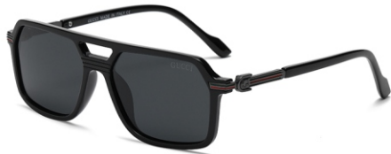
亮黑框 黑灰片 Glossy black