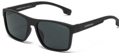
弹黑框 黑灰片 Bullet black