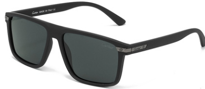
弹黑框 黑灰片 Bullet black