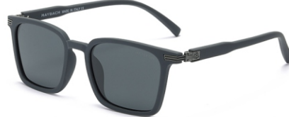
弹灰框 黑灰片 Bullet grey