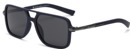
弹蓝框 黑灰片 Bullet blue