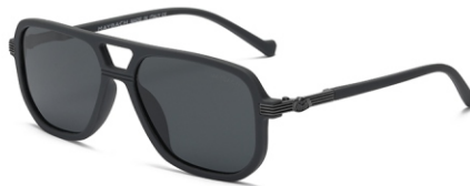
弹灰框 黑灰片 Bullet grey