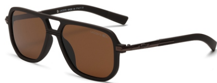
弹棕框 茶片 Bullet brown