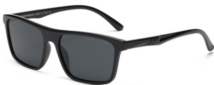
亮黑框 黑灰片 Glossy black