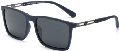
弹蓝框 黑灰片 Bullet blue