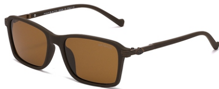
弹棕框 茶片 Bullet brown