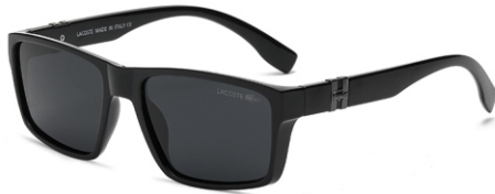
亮黑框 黑灰片 Glossy black