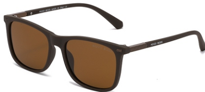
弹棕框 茶片 Bullet brown