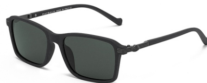
弹灰框 黑灰片 Bullet grey