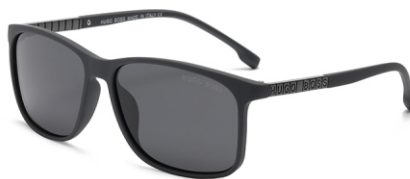
弹灰框 黑灰片 Bullet grey