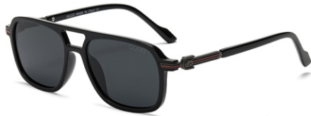
亮黑框 黑灰片 Glossy black