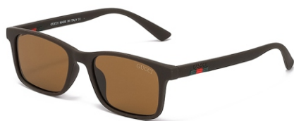
弹棕框 茶片 Bullet brown