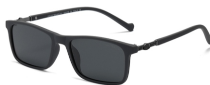
弹灰框 黑灰片 Bullet grey