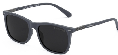
弹灰框 黑灰片 Bullet grey