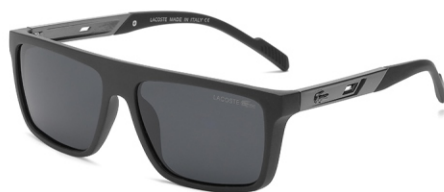
弹黑框 黑灰片 Bullet black