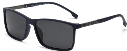
弹蓝框 黑灰片 Bullet blue