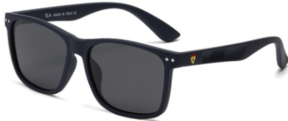
弹蓝框 黑灰片 Bullet blue