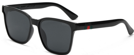
亮黑框 黑灰片 Glossy black