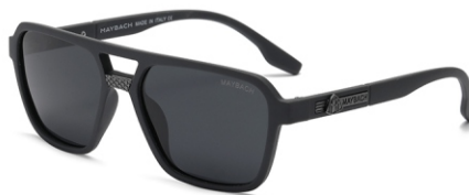
弹灰框 黑灰片 Bullet grey