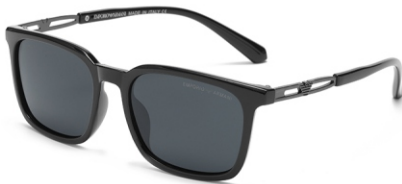
亮黑框 黑灰片 Glossy black