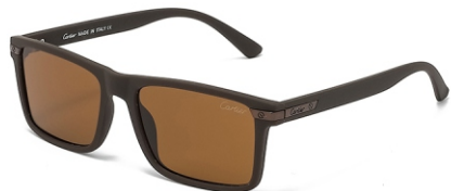
弹棕框 茶片 Bullet brown