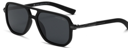
弹黑框 黑灰片 Bullet black