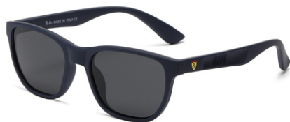
弹蓝框 黑灰片 Bullet blue