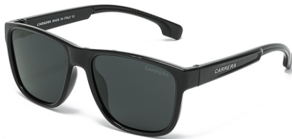
亮黑框 黑灰片 Glossy black